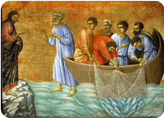
Duccio di Buoninsegna, La pesca miracolosa

Ricorda la tua Galilea e cammina verso la tua Galilea.