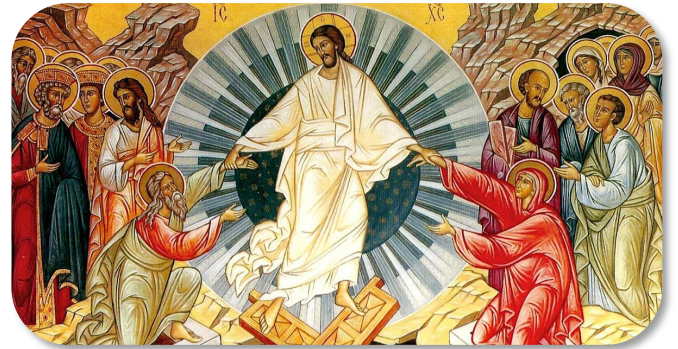
L'icona di Cristo Risorto, Bizantina

«Dal sepolcro la vita è deflagrata. La morte ha perduto il duro agone. Comincia un'era nuova: l'uomo riconciliato nella nuova alleanza sancita dal tuo sangue ha dinanzi a sé la via. Difficile tenersi in quel cammino. La porta del tuo regno è stretta. Ora sì, o Redentore, che abbiamo bisogno del tuo aiuto, ora sì che invochiamo il tuo soccorso, tu, guida e presidio, non ce lo negare. L'offesa del mondo è stata immane. Infinitamente più grande è stato il tuo amore. Noi con amore ti chiediamo amore. Amen».