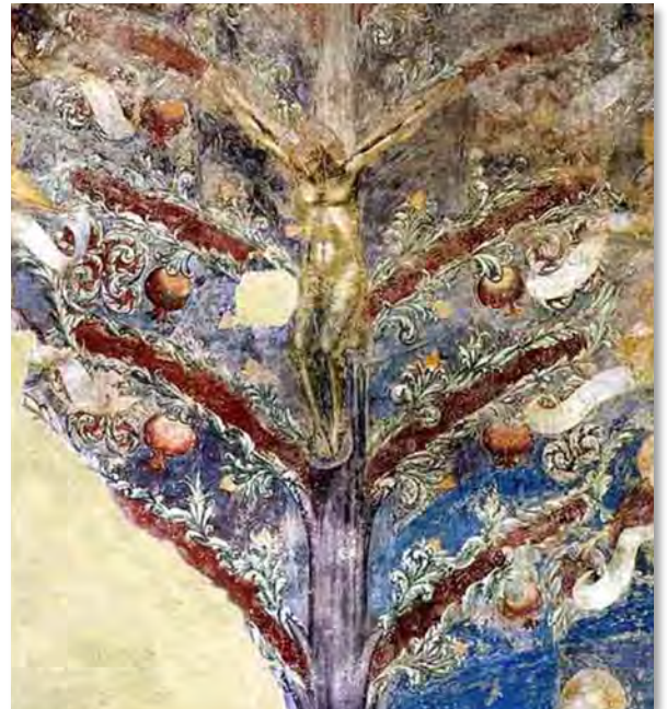
L'Albero della Vita, Abbazia benedettina di Santa Maria in Sylvis a Sesto al Reghena

Disse l'albero: non temere, se sto morendo non temere di morire con me, non temere la morte perché, guarda, rivivo; la morte ha toccato soltanto la scorza.