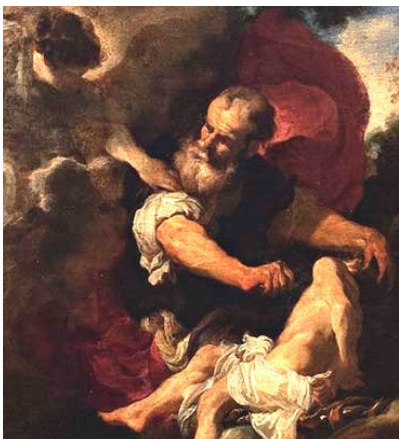
Johann Liss, Sacrificio di Isacco

Chiuderemo noi la Tua piaga quando è Dio stesso che si apre? Quale consolazione procurarti quando è l'Infinito che soffre? Quale amore renderti, o mio Dio, quando è l'Infinito che desidera? A questa rosa che fiorisce nel sesto mese con profumo sublime. al mondo, al suo sesto mese tutto intero che si apre sotto luce inesistente.